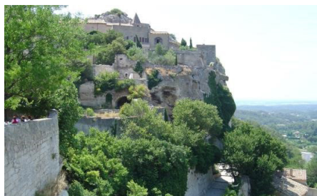
Les Baux de Provence