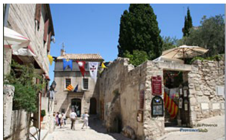
Les Baux de Provence

Le Parc naturel régional des Alpilles est un territoire de 16 communes, dont celle des Baux-de-Provence. Il affiche haut et clair son identité provençale, entre la Camargue et le Luberon. Terre fière et sauvage, la blancheur de ses roches calcaires se détache sur le bleu vif du ciel et laisse la vigne et l'olivier profiter de ses meilleurs versants.